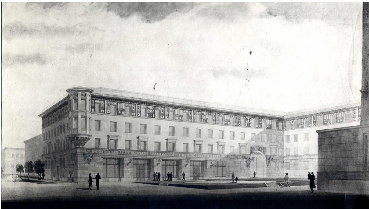
Рис. 1. Проект жилого дома № 29 на улице Тимирязева. Перспектива, архитектурная отмывка

лого человека. Здание освещается мягким рассеянным светом, что с наибольшей полнотой позволяет подчеркнуть соразмерность его пропорций, гармонию всех архитектурных деталей. Общая композиция листа дает полное представление о том, как здание вписывается в городскую среду, его сомасштабность с фигурой человека. Цветовое решение и техника исполнения отвечают самым высоким требованиям изобразительной культуры. Архитектурная отмывка смотрится самостоятельным произведением высокого реалистического искусства и может служить образцом выполнения архитектурного чертежа, развития лучших традиций отечественной школы зодчества.