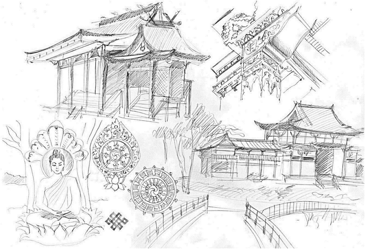
Рис. 2. Эскизы к творческому заданию «Архитектурная фантазия»

нен, что становится самоценной частью проекта, показателем уровня самостоятельности и творческого мышления автора [4]. Из таких зарисовок рождается замысел работы, в них определяется композиционный строй, выявляется образное решение и определяются стилистические черты.