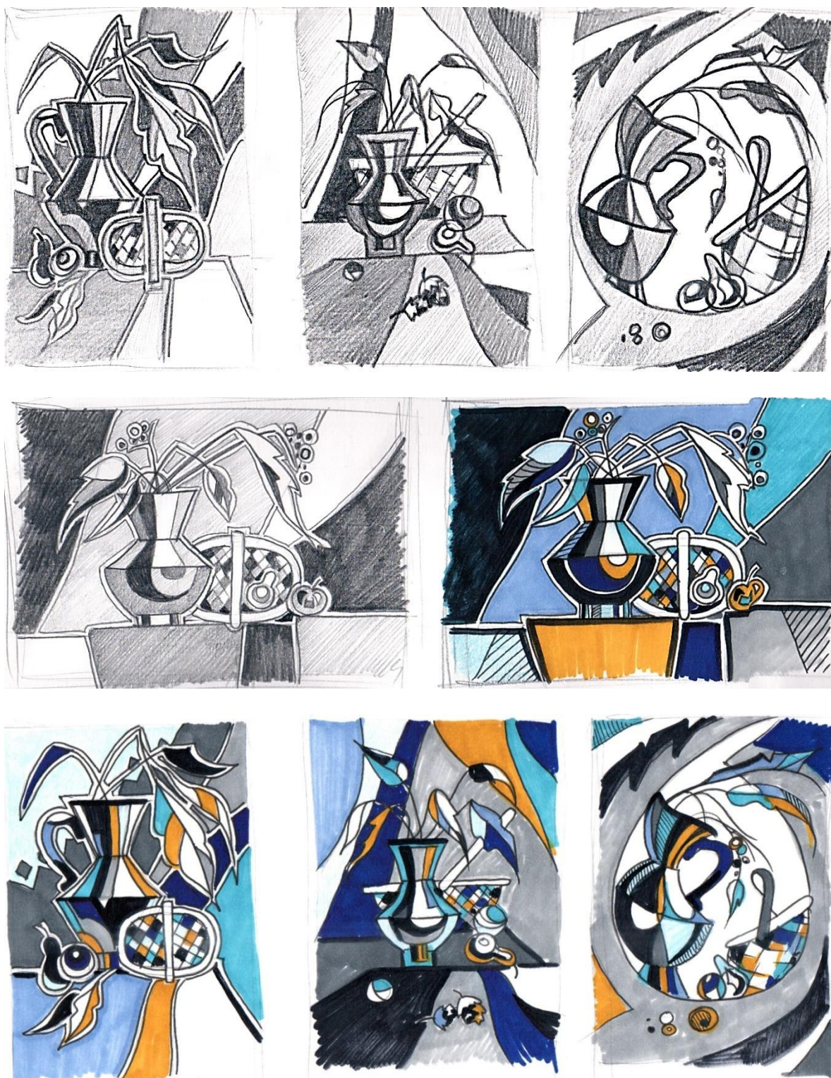
Рис. 3. Композиционные поиски к творческому заданию «Декоративный натюрморт»

Еще одно направление самостоятельной работы студента – совершенствование изобразительного мастерства, работа над техникой рисунка, акварельной графики. Систематические зарисовки помогают в становлении