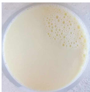
а) соевое «молоко»

* Средние значения по результатам четырех измерений