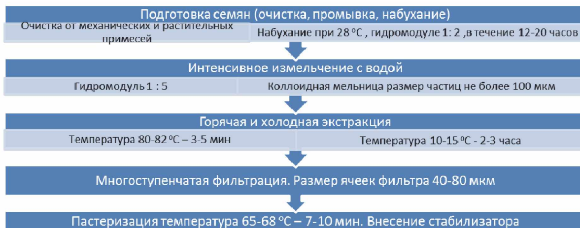
Рис. 1. Технологическая схема производства растительного молока на основе семян конопли

При анализе стабильности напитка при хранении оценивали первичное расслоение эмульсии и выпадение осадка взвешенных частиц. Через 6 суток хранения при температуре (0 +4) °С в контрольном образце наблюдали изменения коллоидной системы напитка: появление выраженного осадка, заметное расслаивание жидкой и твердой фазы. При применении стабилизаторов: геллановой камеди и \beta -циклодекстрина в концентрации 0,3 и 5 %