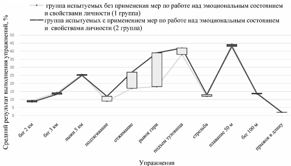
Рис. 1. Сравнение результатов выполнения упражнений группы юношей Fig. 1. Comparison of exercise performance in a male group

После обобщения материалов исследования были установлены критерии оценки уровня физической подготовки допризывной молодежи в двух группах (табл. 1, 2).