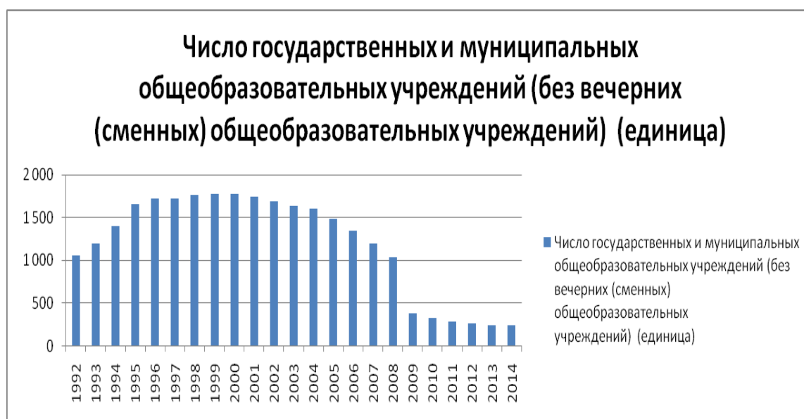
Рис. 1. Число государственных и муниципальных образовательных учреждений по годам

1. Оптимизация системы образования привела к уничтожению сельских «малокомплектных» школ (рис. 1) [5].