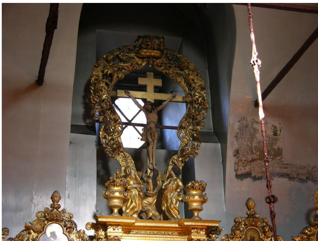
Рис. 4. Наверху иконостаса Рождественской церкви. Господу на Кресте предстоят фигуры святого апостола Иоанна и Пресвятой Богородицы