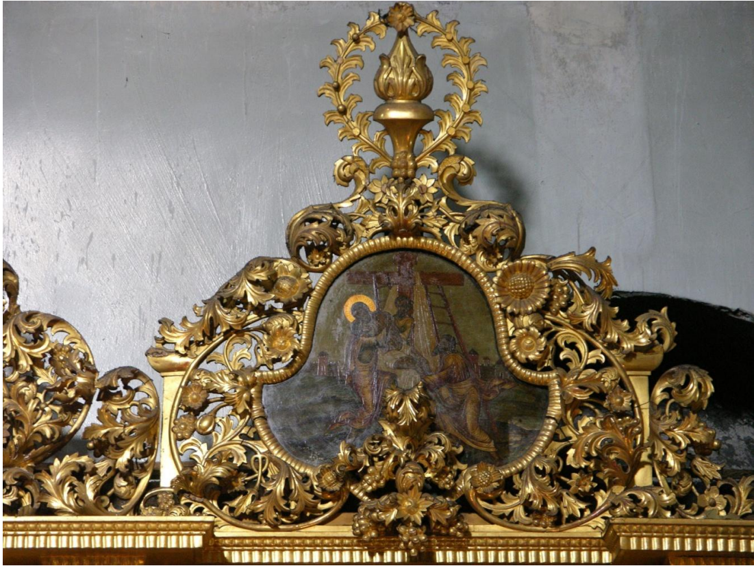
Рис. 5. Завершающие киоты иконостаса Рождественской церкви

Пятиглавый храм с отдельной колокольной, яркий представитель так называемого строгановского стиля. Их отличительной чертой было пятиглавие, внешний и интерьерный барочный декор. Рождественская церковь является памятником русского зодчества в Нижнем Новгороде. Таким образом, на иконостасе при его просмотре сверху вниз перед нами предстает вся история человечества, предстает зримо тот путь, которым Бог ведет все человечество ко спасению.