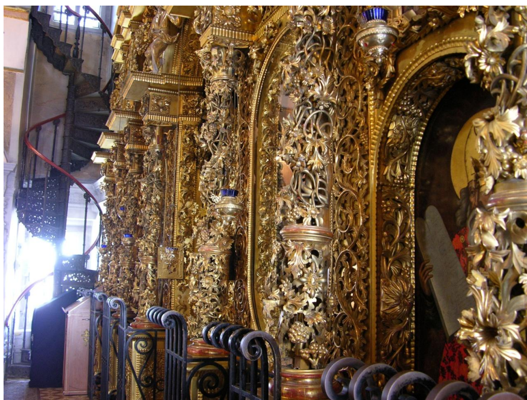
Рис. 2. Местный ряд иконостаса Рождественской церкви