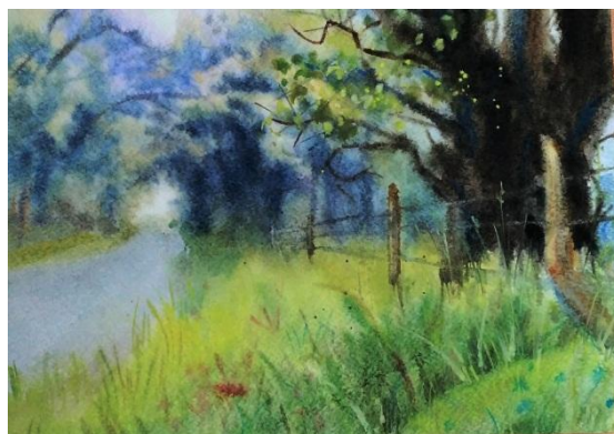
Рис. 1. «Туман», бум., акварель

Когда мы видим, как кто-то действует по-настоящему уверенно (рис. 1–3), будь то спортсмен на соревнованиях или художник в мастерской, нам кажется, что исполнение дается им легко. Однако на самом деле его творческий процесс – это цепочка решений, основанных на долгих годах вдумчивой работы [1].