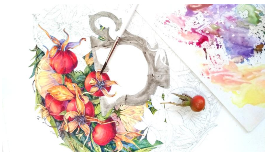
Рис. 5. Работа над «Чайный букет. Иван-чай, шиповник и лимон»