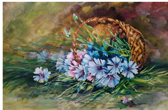
Рис. 3. «Васильки»