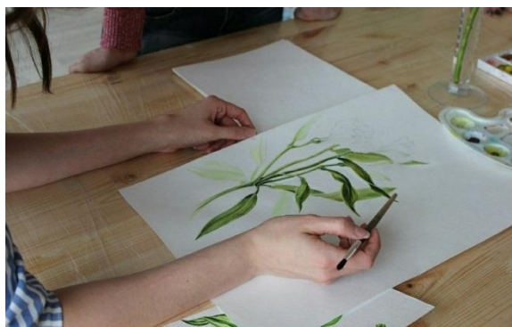
Рис. 2. Этап работы