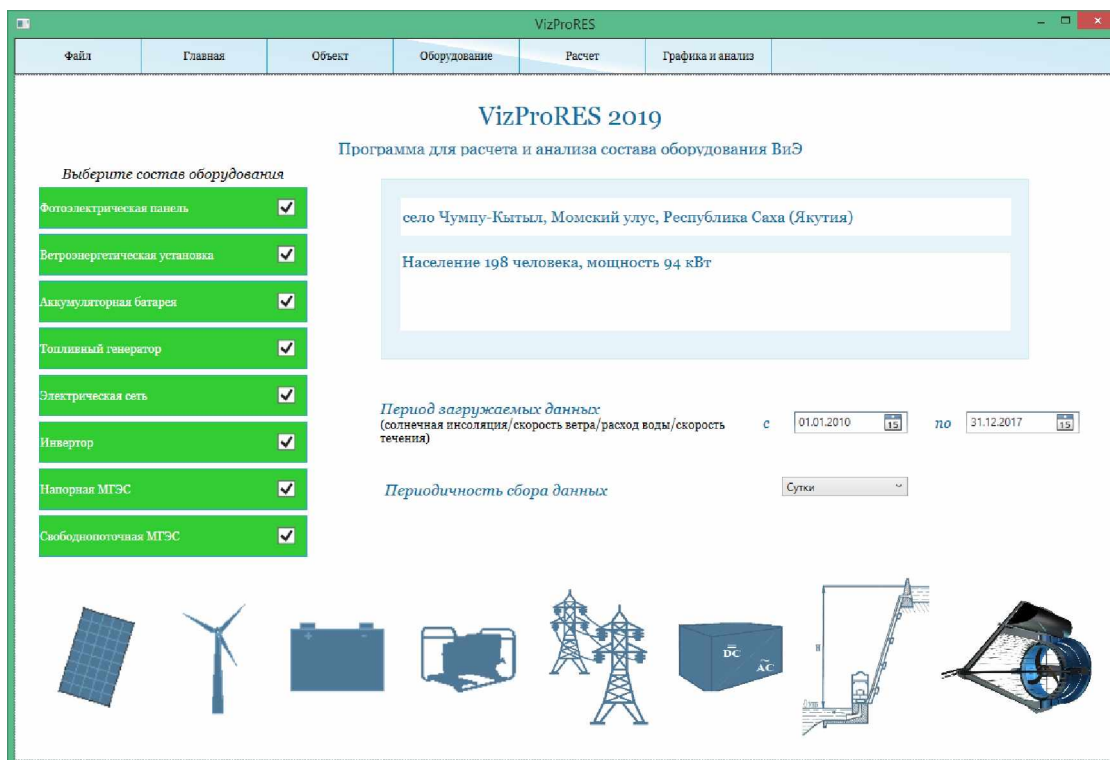
Рис 2. Окно страницы «Главная». Состав оборудования