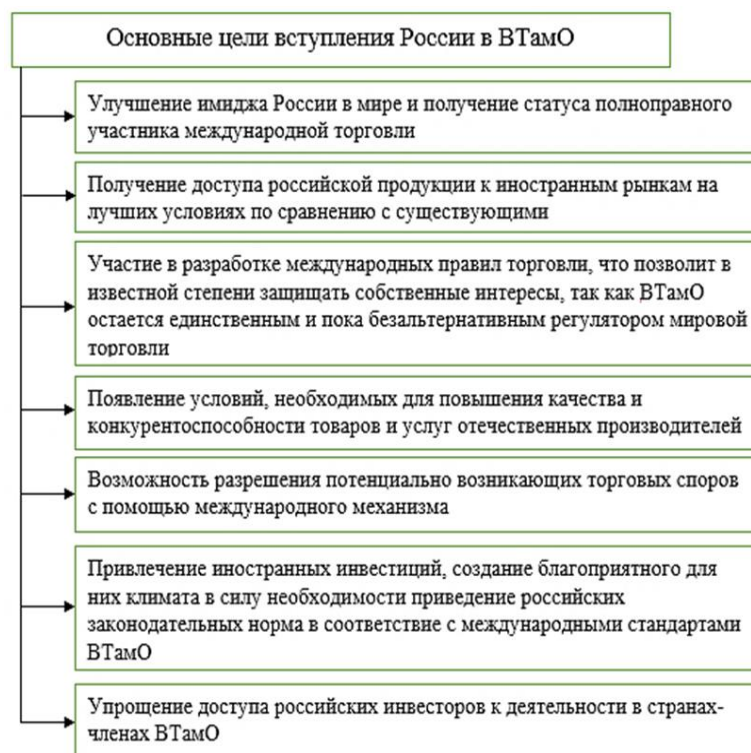
Рисунок 2 – Цели вступления России в ВТО.

На формирование таможенного законодательства России огромное влияние оказывает присоединение страны к Всемирной торговой организации (ВТО). В связи с этим, имеет место постоянное совершенствование таможенного регулирования внешнеэкономической деятельности. Значение такого регулирования особо возросло в современных условиях, так как активно меняется структура товарооборота, растет заинтересованность в унификации таможенного законодательства в разных странах.