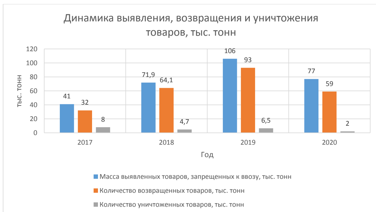
Рисунок 7 – Динамика выявления, возвращения и уничтожения товаров за период 2017 – 2020 гг., тыс. тонн

Рассмотрим динамику изменения количества выявленных, возвращенных и уничтоженных товаров в весовом выражении (тыс. тонн), запрещенных к ввозу (рисунок 7).