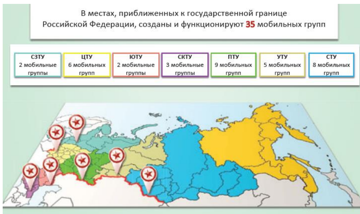
Рисунок 1 – Места функционирования мобильных групп на границе Российской Федерации

Северо-Западное таможенное управление (далее СЗТУ) является часть общего механизма таможенные органов РФ федерального значения. СЗТУ исполняет поставленные ФТС РФ цели в Северо-Западном федеральном округе (за исключением Калининградской области). Производит контроль приграничных территорий, в частности границы с Финляндией, Норвегией, Эстонией, Латвией и Белоруссией. Общая протяженность приграничных территорий составляет около 2,7 тысячи км. СЗТУ включает в себя такие области России как: Ленинградская, Мурманская, Архангельская, Вологодская, Псковская, и Новгородская области, республики: Карелия и Коми, Ненецкий автономный округ, а также город Санкт-Петербург и