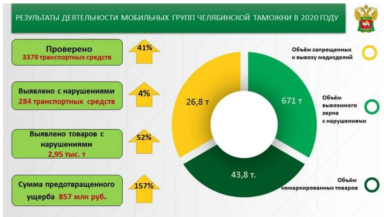
Рисунок 4 – Результаты деятельности мобильных групп Челябинской таможни в 2020 году

оптимизация проведения таможенных процедур и проверок является для них очень важным моментом. Данная оптимизация позволит сократить все расходы, возложенные на предприятия.