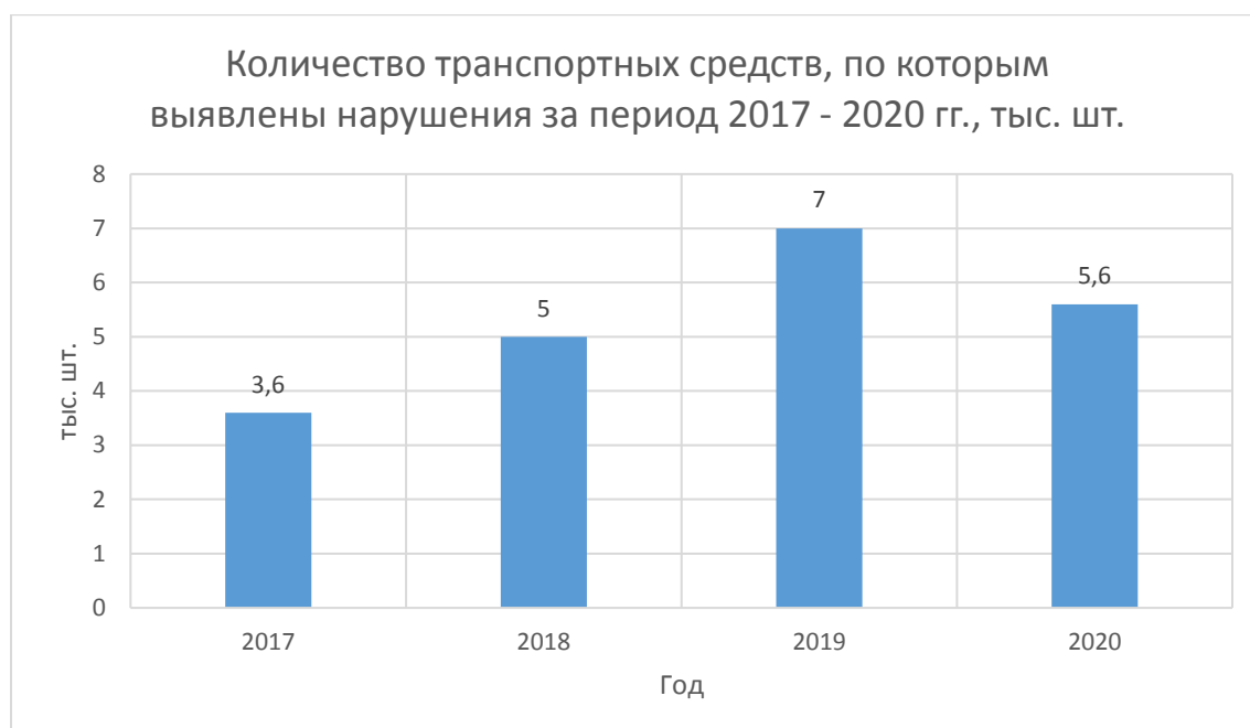
Рисунок 6 – Динамика изменения количества транспортных средств, по которым выявлены нарушения за период 2017 – 2020 гг., тыс. шт.

Рассмотрим динамику изменения количества выявленных, возвращенных и уничтоженных товаров в весовом выражении (тыс. тонн), запрещенных к ввозу (рисунок 7).