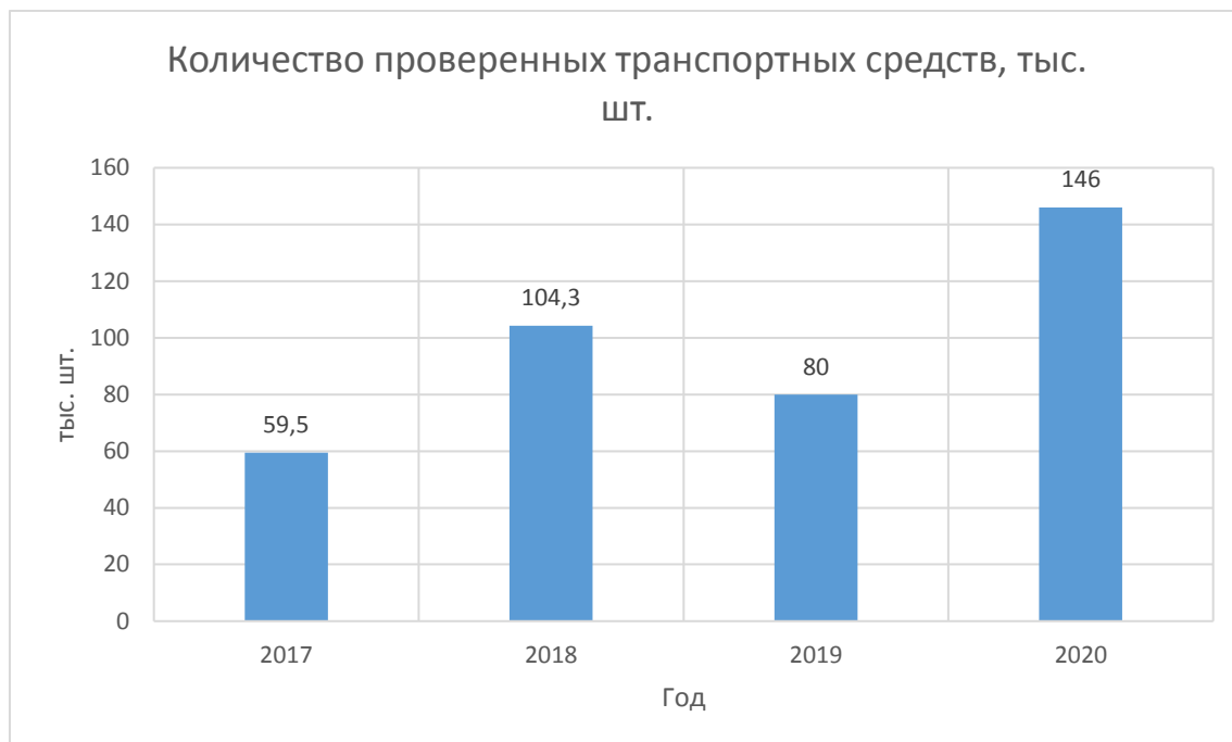
Рисунок 5 – Динамика изменения количества проверенных транспортных средств за период 2017 – 2020 гг., тыс. шт.

Можем сделать вывод из рисунка 5, что в 2020 году (несмотря на пандемию) было самое большое количество проверяемых транспортных средств, исходя из увеличения участников внешнеэкономической деятельности и образования большего количества проверяемых транспортных средств.