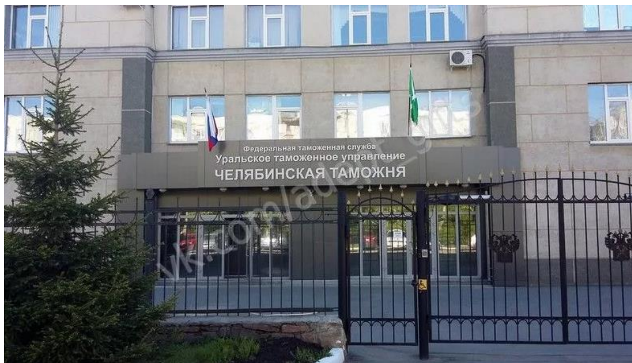
Рисунок 3 – Здание Федеральной таможенной службы УТУ Челябинская таможня

На рисунке 3 можно увидеть фасад здания Федеральной таможенной службы УТУ Челябинская таможня.