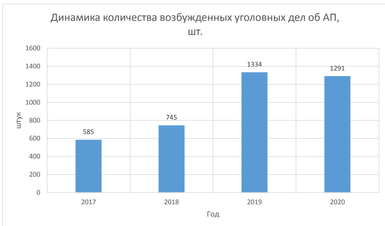
Рисунок 8 – Динамика изменения количества возбужденных уголовных дел об АП за период 2017 – 2020 гг., шт.

На рисунке 8 приведена динамика количества возбужденных уголовных дел об административных правонарушениях (далее АП).