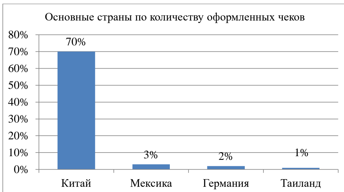
Рисунок 3 – Основные страны по количеству оформленных чеков Tax Free за 2018 год

В рамках чемпионата мира FIFA2018 таможенными органами было оформлено более 11 тыс. чеков Tax Free на общую сумму 4 миллиарда рублей. Основные страны по количеству оформленных чеков Tax Free были показаны на рисунке 3.