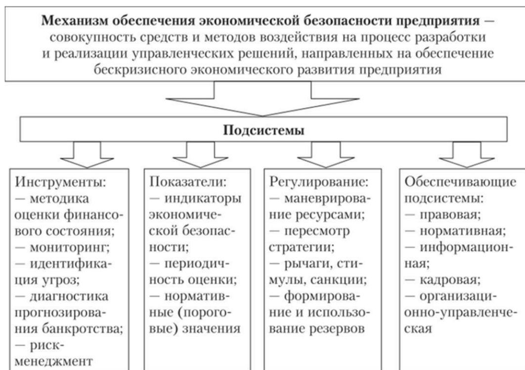
Рисунок 1.1 – Механизм обеспечения экономической безопасности предприятия

При построении системы обеспечения экономической безопасности должны последовательно решаться следующие задачи: