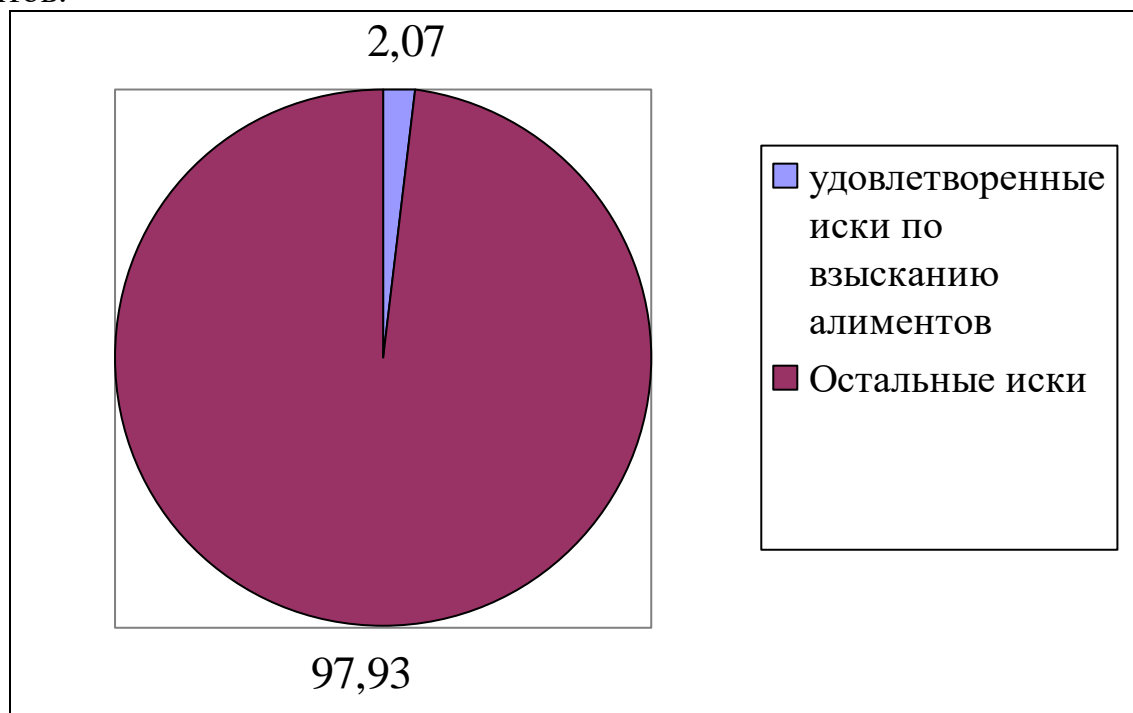
Рисунок 3 – Долевое отношение удовлетворенных исков по взысканию алиментов к общему количеству исков в 2020 году

Согласно статистике Верховного Суда РФ, в 2020 году было рассмотрено 38 478 тыс. дел из которых 795,8 тыс. удовлетворенные иски по взысканию алиментов.