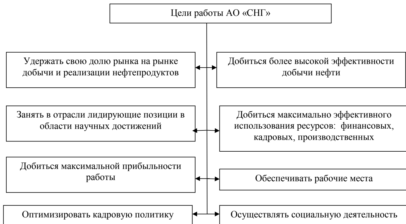
Рисунок 1.2 - Основные цели работы АО «СНГ»

– услуги по приему, транспортировке и сдаче нефти в систему ОАО «АК «Транснефть» сторонних организаций – участников транспортной схемы Северных месторождений.