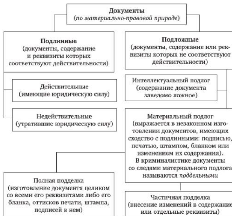
Рис. 1. Виды документов (по материально-правовой природе)» 2 .

Документы по степени подлинности показаны на рисунке 1.