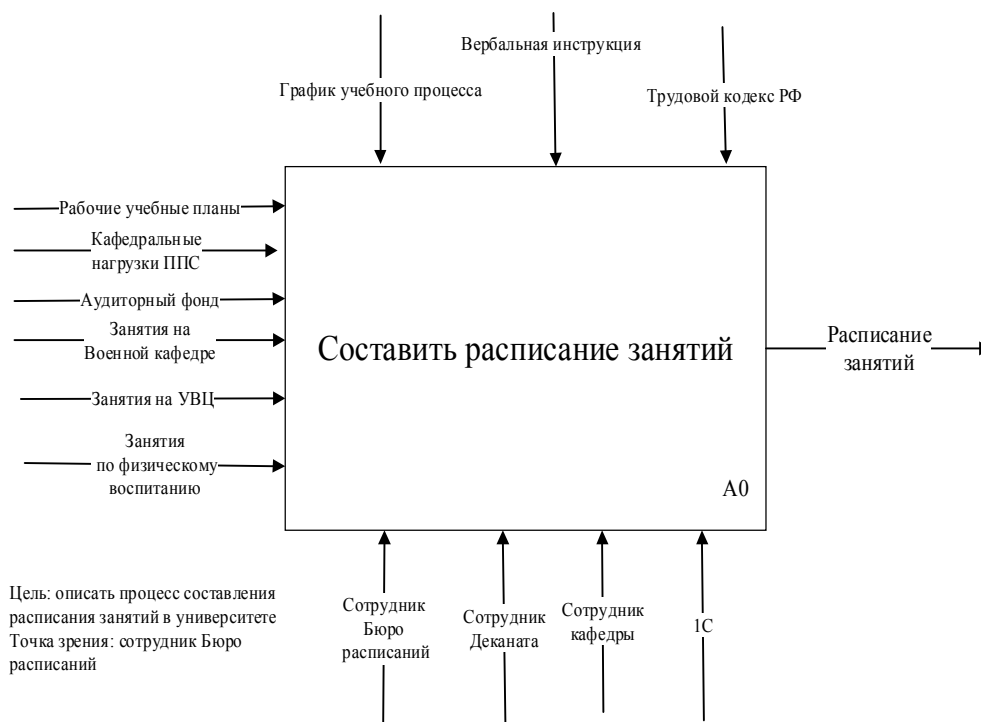
Рис. 1. Контекстная диаграмма процесса составления расписания занятий «как есть» Fig. 1. Context diagram of the process of scheduling classes «as is»

На рис. 1 показана контекстная диаграмма описанного процесса составления расписания занятий в нотации IDEF0.