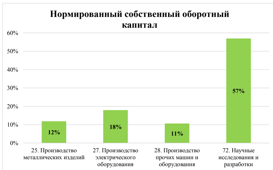
Рис. 1. Оборотный капитал некоторых отраслей Fig. 1. Working capital of some industries

Содержательно процедура финансирования предприятий научных разработок включает фиксированный заказ, длительный срок изготовления продукции (средний срок – 238 дней), большую дебиторскую задолженность, в том числе за счет авансирования поставщиков (средний срок – 291 день), большую кредиторскую задолженность, в том числе за счет полученных авансов (средний срок – 425 дней), практическую невозможность срыва сроков заказов. Финансирование гражданской продукции несколько отличается: неопределенность (волатильность) спроса, относительно короткие сроки изготовления, постоплата, допустимость переносов заказов.