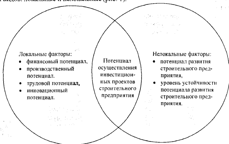
Рис. 1. Структура потенциала осуществления инвестиционных проектов строительного предприятия

Потенциал осуществления инвестиционных проектов строительного предприятия позволяет обобщить оценку возможностей и способностей строительного предприятия. Он формируется под воздействием различных взаимосвязанных и взаимообусловленных факторов. Несмотря на многообразие и неоднозначный характер действия, факторы могут двух видов: локальные и нелокальные (рис. 1).