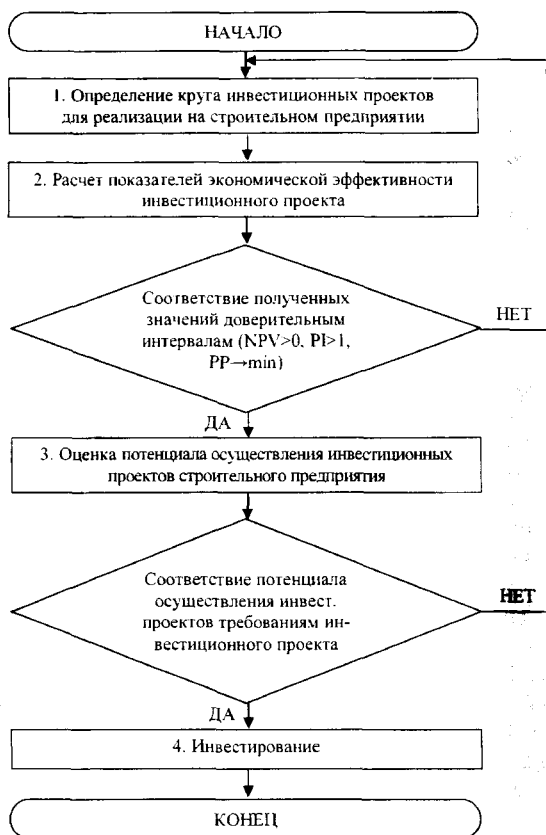
Рис. 3. Алгоритм принятия инвестиционных решений с использованием потенциала осуществления инвестиционных проектов строительного предприятия.