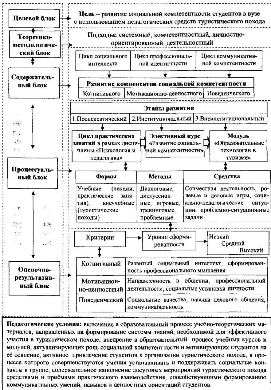
Рис. 1. Структурно-функциональная модель развития социальной компетентности студентов в вузе с использованием педагогических средств туристического похода