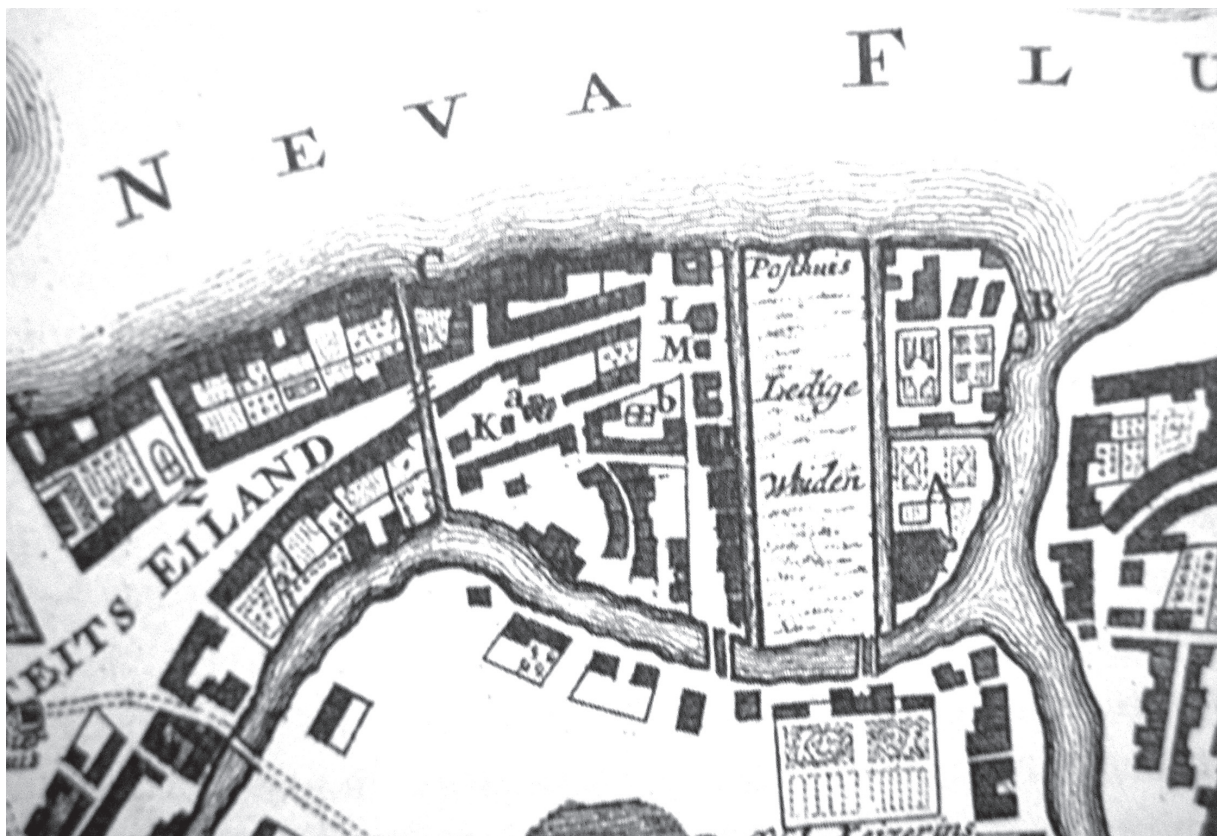
Рис. 2. Фрагмент плана Санкт-Петербурга 1718 г. РНБ

чертеж 1 . На плане Майера хорошо просматриваются здание католической церкви и принадлежавший ей обширный земельный участок. Благодаря ряду ориентиров — Главной аптеке, план которой с Петровских времен почти не изменился, реке Мойке, а также сохранившей свои очертания Миллионной улице (бывшей Немецкой) — путем простого совмещения современной карты (снимка со спутника) равного масштаба с планом Майера легко обнаружить место, когда-то занимаемое церковной постройкой (рис. 3). Очевидно, что храмовая терри-