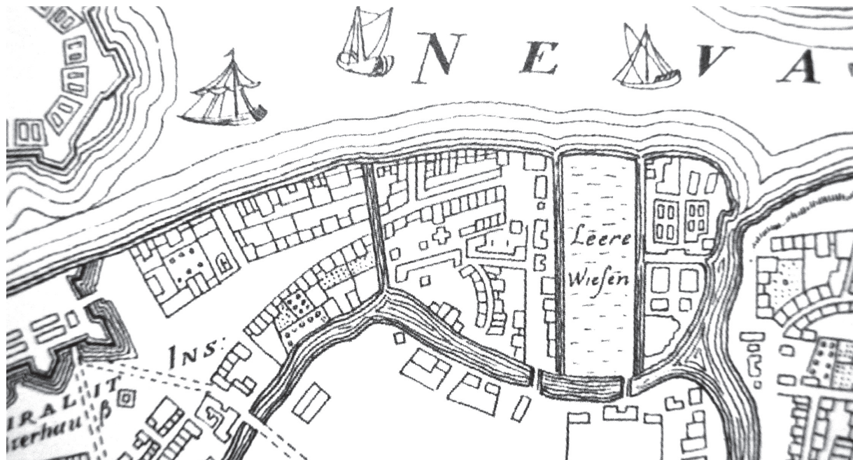
Рис. 1. Фрагмент плана Санкт-Петербурга с Адмиралтейским островом (1716—1717).

многие исследователи отождествляют с Греческой улицей Немецкую (ныне Миллионную), выскажем соображения по поводу их местоположения. Обе улицы входили в так называемую Немецкую слободу (иногда ее именовали также и Греческой 1 ), однако собственно Греческий квартал, где проживали родившиеся на берегах Адриатического моря служащие Галерного флота, располагался ближе к Мойке [12, с. 264]. Поэтому Греческой правильнее считать небольшую улицу, шедшую параллельно Немецкой (Большой, Луговой) (вспомним, что католики приобрели землю «на Адмиралтейской стороне, от берега на второй улице»). Теперь она застроена, однако ее можно увидеть на планах и картах Петербурга Петровского времени. Например, на плане 1716—1717 гг. эта улица идет от Зимней канавки к Царицыну лугу (Марсову полюю); именно на ней находились финская лютеранская церковь (крестообразная в плане, обозначенная буквой «а») и прямоугольная в плане католическая церковь, несколько отодвинутая вглубь двора, окруженная с двух сторон зданием неправильной формы (обозначена буквой «б») 2 (рис. 1). Это здание расположено на участке церковной земли, очерченном на плане, и,