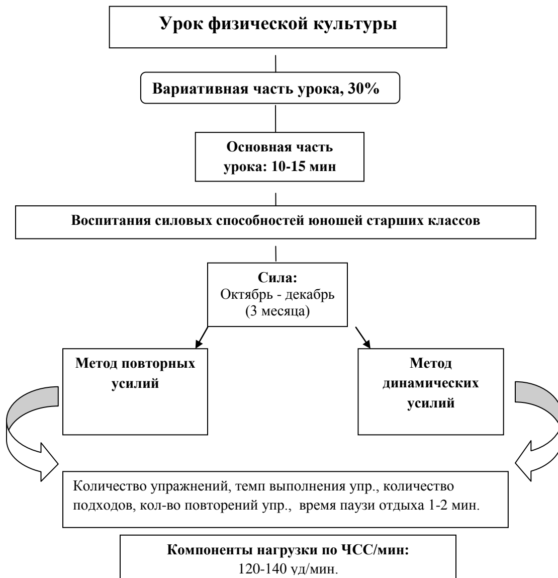
Рисунок 2 – Схема построения модульной методики воспитания силовых способностей юношей

стимулируют увеличение степени напряжения мышц. Применялись упражнения с внешним сопротивлением, упражнения с преодолением веса собственного тела, изометрические упражнения.