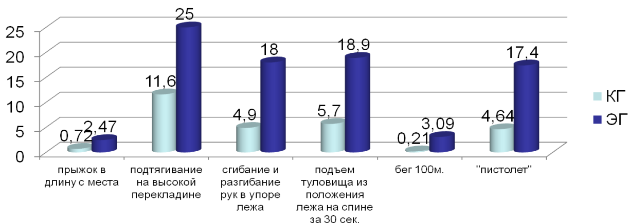
Рисунок 4 – Сравнительный анализ прироста физической подготовленности юношей старших классов

После педагогического эксперимента участники ЭГ и КГ показали следующие результаты, характеризующие уровень физической подготовленности.