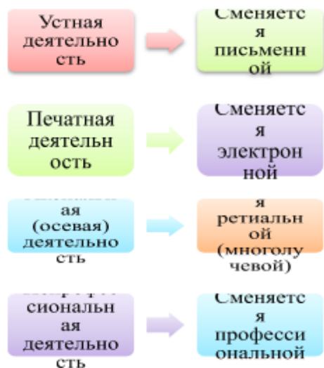
Рисунок 1.2 – Черты влияния глобализма на профессиональную деятельность журналиста

Профессия «журналист», согласно мнению А.К. Бобкова, развивается по спирали 18 . Развитие по спирали профессии журналиста представляется данным автором в виде обращения к уже известным ранее профессиональным качествам на новом витке. А.К. Бобков указывает, что на современном этапе журналисты из профессионалов становятся полу профессионалами, из творческих личностей - информационными, из реальных - виртуальными.