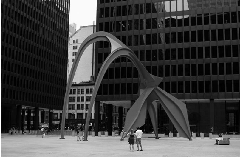
Рис. 6. Федеральная площадь в Чикаго. Композиция «Фламинго». Скульптор А. Колдер

Выразительность и единство художественных форм в системе пластических искусств строятся на общих композиционных категориях, проявляющихся в виде первичных закономерностей гармонии: симметрии, асимметрии, контраста, нюанса, ритма, пропорций. Организованное пространство является сплавом всех этих свойств, сформулированных художественным языком искусства [3].