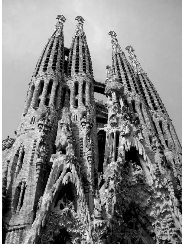
Рис. 1. Собор Святого Семейства в Барселоне. Архитектор А. Гауди