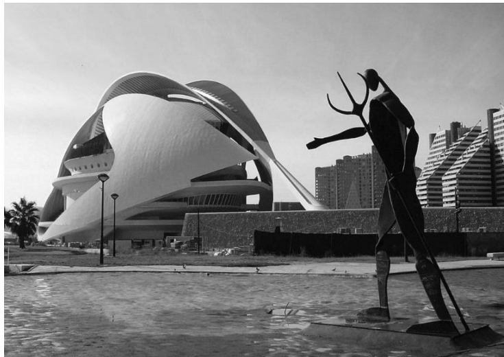
Рис. 5. Город искусства и науки в Валенсии. Архитектор С. Калатрава

Встречное движение формообразования в архитектуре и скульптуре можно наблюдать в комплексе Города искусства и науки в Валенсии, созданного под руководством Сантьяго Калатрава. Стремление к пластическому единству позволило сформировать ансамбль, безусловно ставший выдающимся произведением архитектуры конца XX века (рис. 5).