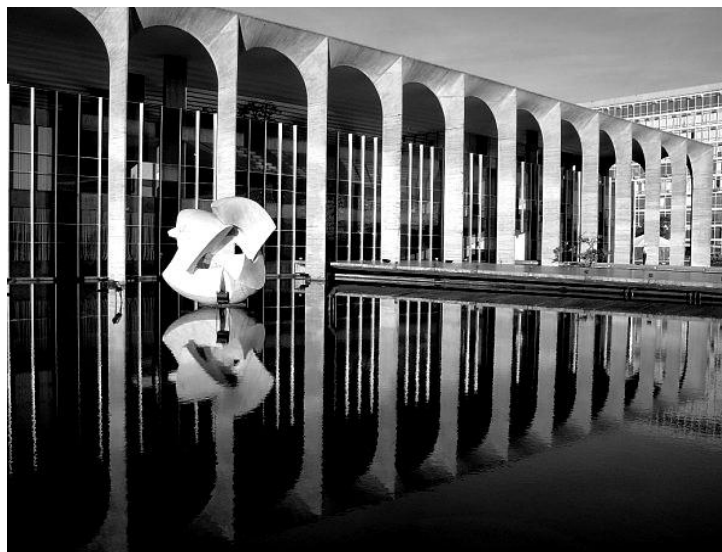
Рис. 3. Дворец Итамарати в Бразилиа. Архитектор О. Нимейер. Композиция «Метеор». Скульптор Б. Джорджи

XX век оставил немало ярких образцов синтеза пластических искусств, среди которых некоторые можно считать знаковыми с точки зрения используемых композиционных приемов. Одними из наиболее выдающихся примеров являются ансамбли новой столицы Бразилии.