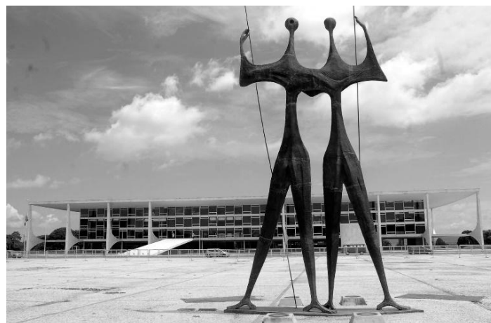
Рис. 4. Площадь Трех Властей в Бразилиа. Архитектор О. Нимейер. Композиция «Воины». Скульптор Б. Джорджи