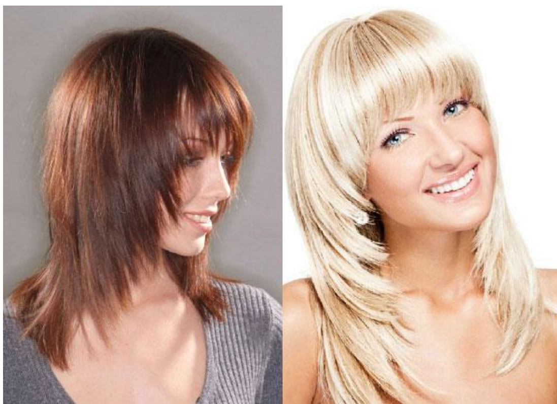
Рисунок 3 — Стрижка «Дебют»

совсем. Длина стрижки также может быть весьма разнообразной. Дебют прекрасно смотрится как на коротких, так и на длинных волосах (рисунок 3).