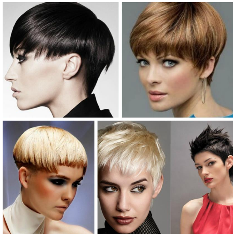
Рисунок 2 — Стрижка «Гарсон»

шарма. Короткая стрижка «Гарсон» выполняется с помощью градуирования. Плавных переходов и четких линий помогает добиться филировка. Отличительной чертой этой прически является минимальная длина на нижнезатылочной зоне и объем сверху. Стрижка подчеркивает тонкую шею и черты лица, добавляет объема волосам, легко поддается укладке. Стрижка подходит женщинам любого возраста (рисунок 2).