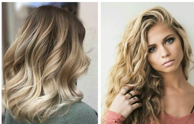
Рисунок 5 — Укладка волос

Укладка волос — это ежедневный ритуал многих женщин. Но часто хочется (а иногда бывает просто необходимо) отойти от повседневного образа и примерить стильную, профессионально выполненную прическу. Среди всех видов укладок всегда были актуальны локоны (рисунок 5).