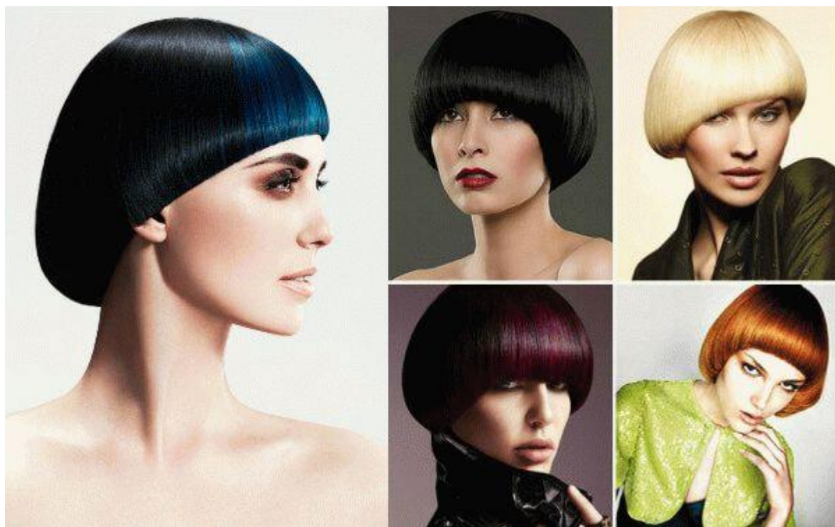
Рисунок 1 — Стрижка «Сессун»

Стрижка «Сессун» пришла к нам из 60-х гг. Данная стрижка имеет немалое количество вариаций, что позволяет предложить красивые стрижки на различную длину волос и тип лица (рисунок 1).