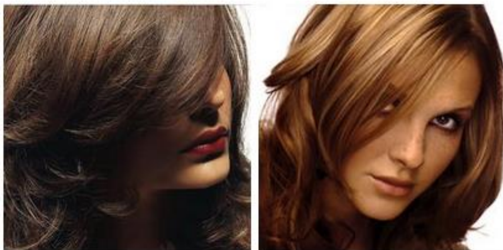
Рисунок 4 — Окрашивание волос по технологии PAINTING