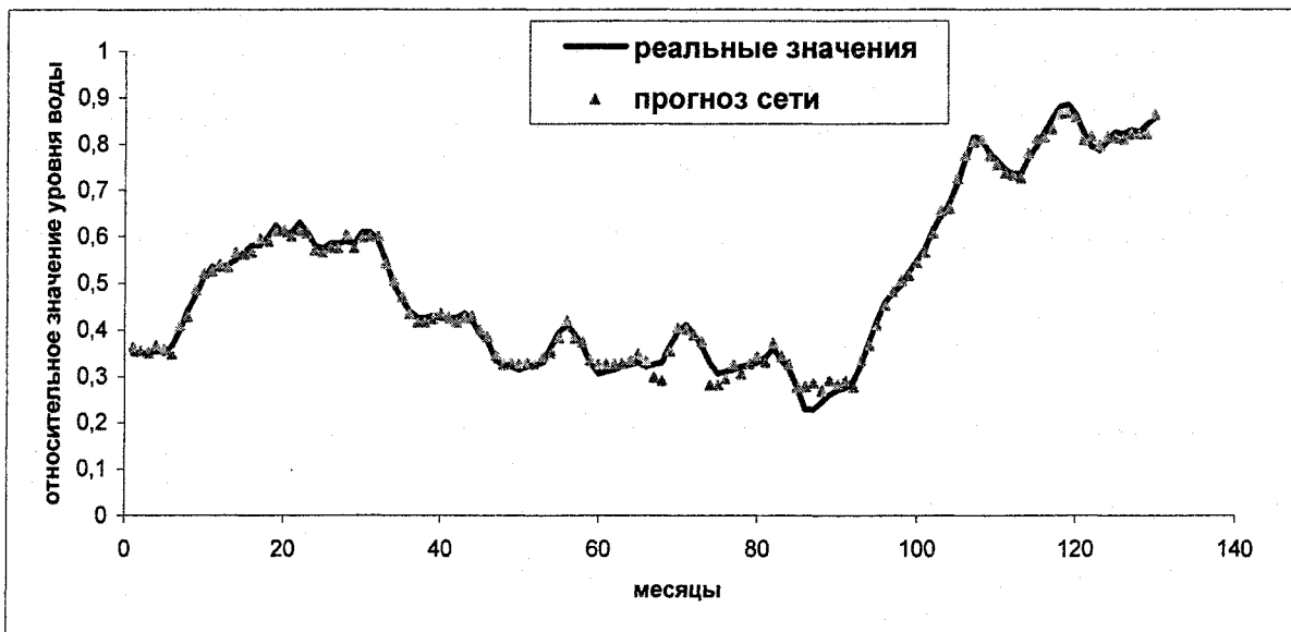
Рис. 2. Выполнение нейронной сетью процесса обучения и тестирования

Таким образом, при выполнении данной работы апробирован новый подход к моделированию динамики изменения уровня воды в водоеме-хранилище радиоактивных отходов с помощью искусственных нейронных сетей. При планировании мер по защите качества окружающей среды используя данный метод, наравне с другими, можно провести анализ эффективности проводимых