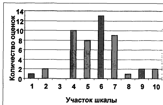
Рис. 4. Распределение оценок испытуемого с низкой детализацией

Предпочтения к высокой детализации связаны, в первую очередь, с особенностями оценочного основания, которое, в данном случае, имеет более сложную организацию, чем у лиц с низкой детализацией. Здесь играет свою роль имеющийся опыт взаимодействия с различными объектами и способность структурировать этот опыт «удобным» для субъекта образом.