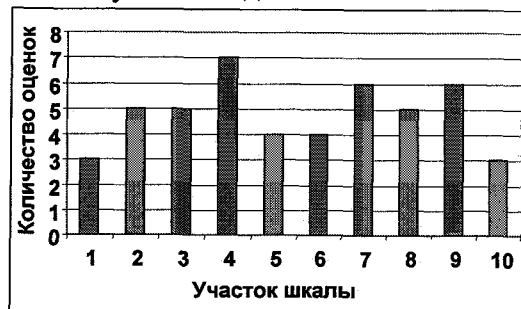
Рис. 3. Распределение оценок испытуемого с высокой детализацией

На рис. 3 и 4 приведены диаграммы, иллюстрирующие распределение оценок испытуемых, характеризующихся высокой и низкой детализацией. При построении распределений были использованы оценки, которые давались по всем шкалам и объектам-стимулам методике «ES».