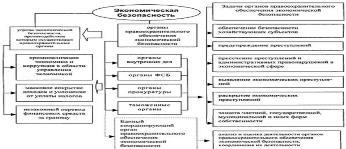
Рисунок 2 Правоохранительные органы обеспечения экономической безопасности и их задачи

Система правоохранительных органов обеспечения экономической безопасности представлена на рисунке 2.