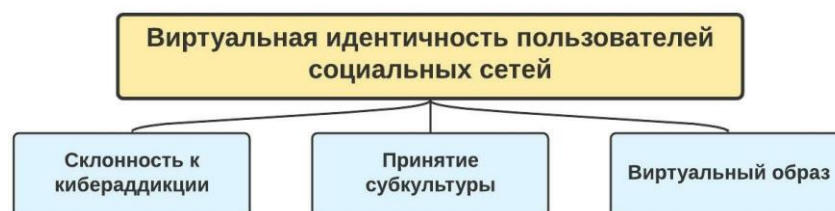
Рисунок 2. – Компонентная структура виртуальной идентичности

В параграфе 3.1 «Психологическая структура виртуальной идентичности пользователей социальных сетей» описана внутренняя компонентная и внешняя факторная структура виртуальной идентичности. Факторный анализ результатов теста «ВИПСС» позволил сделать вывод о воспроизводимости внутренней компонентной структуры виртуальной идентичности (рисунок 2), включающей такие компоненты, как «склонность к кибераддикции», «принятие субкультуры», «виртуальный образ». Виртуальная идентичность, при определенной автономности входящих в ее состав компонентов, характеризуется их качественным своеобразием. В связи с этим, эмпирически подтверждена первая частная гипотеза.