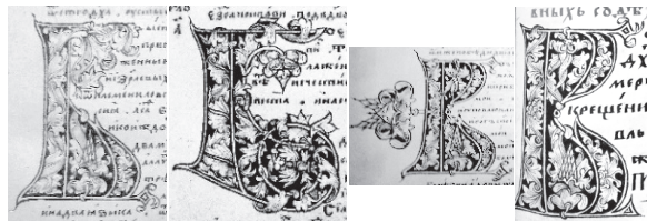
Рис. 3. Буквицы, исполненные Федором Басовым в рукописях «Псалтырь с воследованием и Апостол» [21, л. 1, 13, 22 об.] 1586—1587 гг. и «Мерило праведное» 1586 г. [7, л. 395]

в ранних заказах — книгах «Мерило праведное» и «Псалтырь с воследованием и Апостол» — стали яркими примерами проявления авторского начала в искусстве Федора Басова (рис. 3).