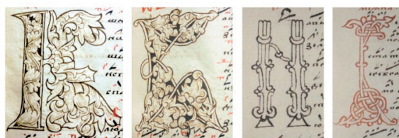
Рис. 5. Буквицы, исполненные Федором Басовым в рукописях 1590-х гг. «Ирмологий певческом» [11, л. 42, 59] и «Стихираре певческом» [30, л. 273, 318]

Интересно, что в создании инициалов одной рукописи, Федор редко, но обращался к иным орнаментальным стилям, модифицируя старопечатную традицию или отказываясь от нее полностью, к примеру, в пользу балканской (рис. 5). Такая манера исполнения характерна для незначительной части орнаментики художника-знаменщика.