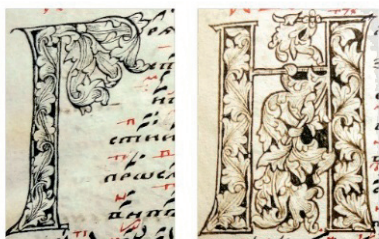
Рис. 4. Буквицы, исполненные Федором Басовым в рукописях «Псалтырь с воследованием» 1585—1586 гг. [9, л. 112] и «Ирмологии певческом» [11, л. 48], 1590-х гг.

В творчестве художника-знаменщика Федора Басова представлена группа буквиц, сохраняющая в структурном решении строгую вертикаль. Но от нее листовыми изгибами исходят диагональные и горизонтальные очертания (рис. 4).