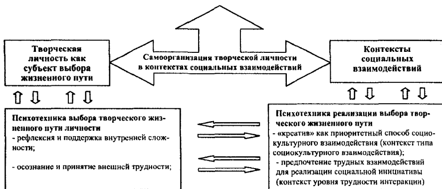
Рис. 1. Базовая модель выбора творческого жизненного пути личности

Самоорганизация творческой личности как субъекта выбора жизненного пути в контекстах социальных взаимодействий осуществляется посредством специфических компонентов обеих психотехник. Базовая модель выбора творческого жизненного пути личности представлена на рисунке (рис. 1).