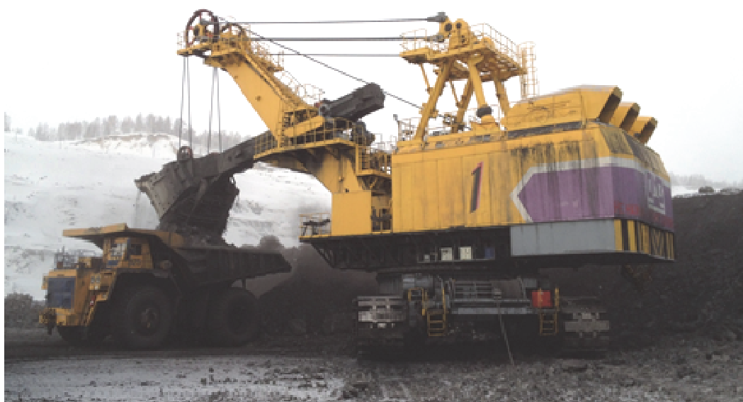
Рис. 2. Внешний вид экскаватора ЭКГ-32