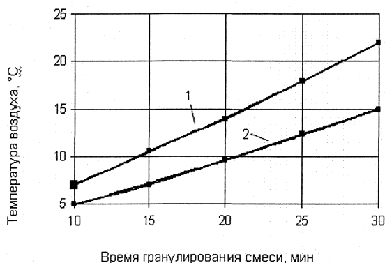
Рис. 2. Зависимость времени гранулирования асфальтобетонной смеси от температуры воздуха